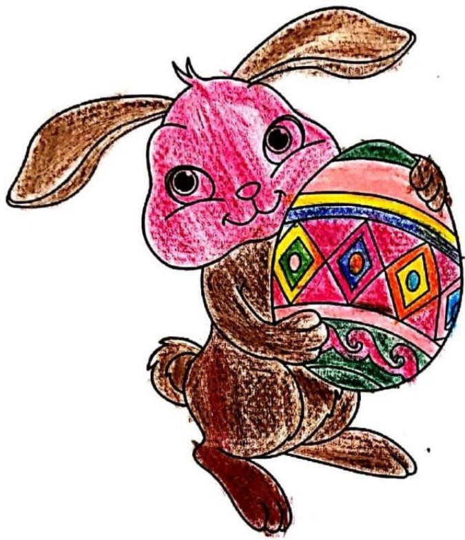
Disegno di Giulia Porro