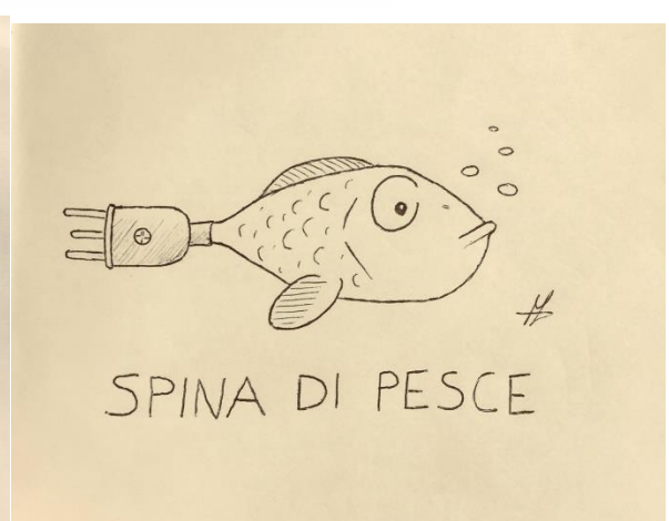
Illustrazioni realizzate da Michele Antonelli