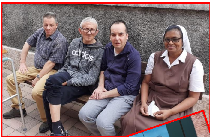
foto dei ragazzi, segnalibri prodotti alla Piccola e colorati dagli utenti e dei rosari.

È difficile racchiudere in poche parole la gratitudine per il lavoro svolto alla Piccola, la loro presenza è stata di completa dedizione verso i ragazzi, operatori, volontari, ecc. Hanno sempre avuto una parola buona per tutti, una preghiera, un pensiero. Porgiamo loro un grosso in bocca al lupo per la loro missione e per i traguardi futuri. Resteranno sempre nel nostro cuore e diciamo loro con molta semplicità, GRAZIE!