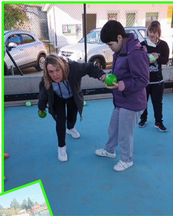
Gli aspiranti bocciofili