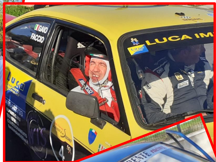
I ragazzi della C.A. e del C.D.