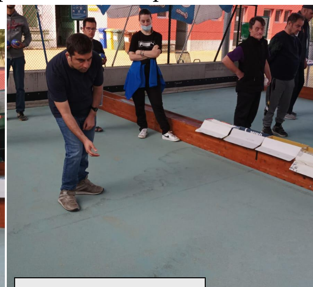
Si va a punto